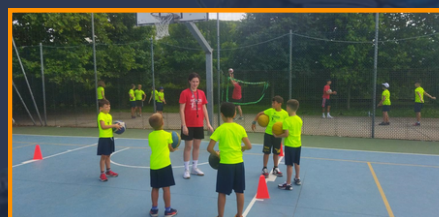
Pallacanestro e basketin