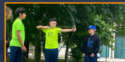
Tiro con l'arco